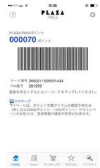
PLAZA PASS 会員画面