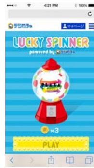
Lucky Spinner プレイ画面

ゲーミフィケーションの要素を用いた、ポイントカードのスマホアプリです。本アプリをダウンロードし、「会員登録」や「お店へのチェックイン」をすると、PLAZA PASS オリジナルデジガチャ「Lucky Spinner」をプレイすることができます。「Lucky Spinner」を回すと、もれなくデジタルコンテンツがもらえると同時に、12月からのスタート特典として、お店でお買い物をしたときに貯まる「PLAZA PASS ポイント」がもらえます。